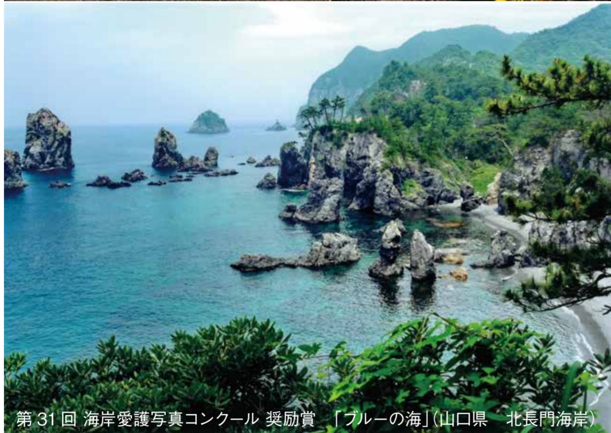
第31回 海岸愛護写真コンクール 奨励賞 「ブルーの海」(山口県 北長門海岸)