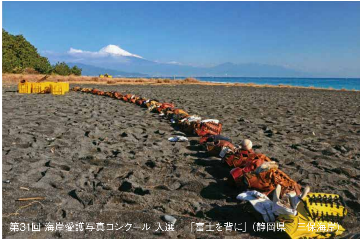
第31回 海岸愛護写真コンクール 入選 「富士を背に」(静岡県 三保海岸)