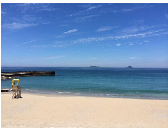
【古里港海岸】（長崎市）