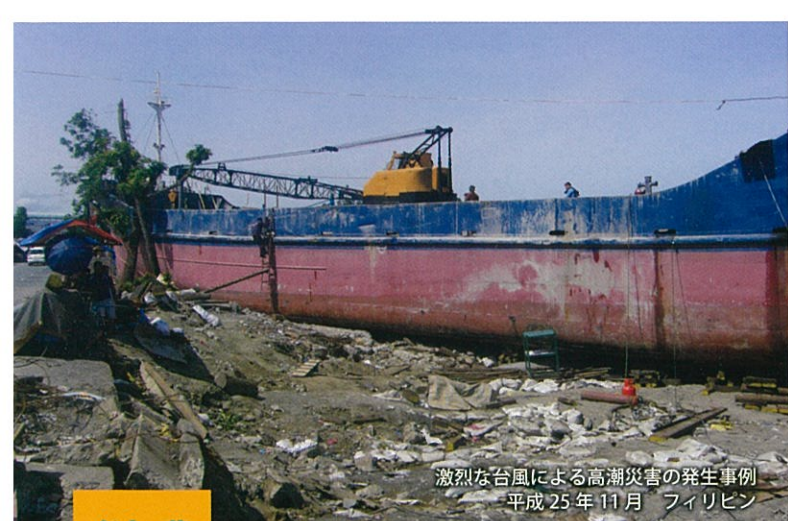
激烈な台風による高潮災害の発生事例 平成25年11月 フィリピン