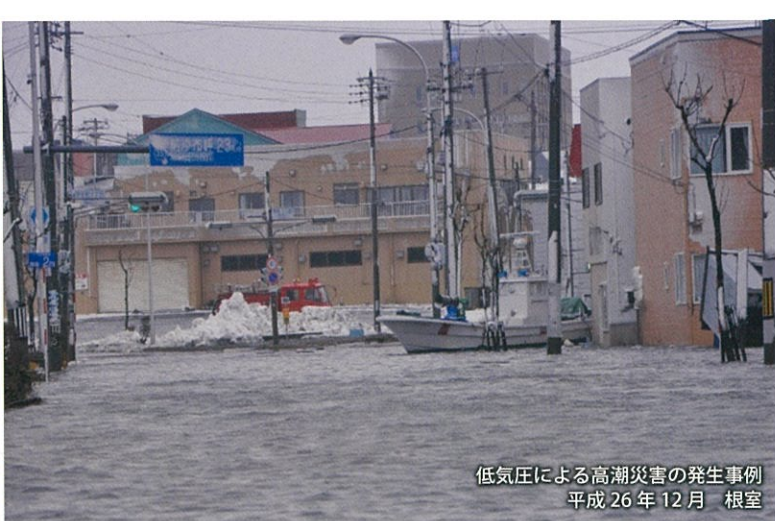
低気圧による高潮災害の発生事例 平成26年12月 根室